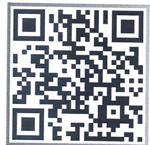
QR CODE สมัครอบรม

สอบถามเพิ่มเติมได้ที่ นางสาวรณาทิพย์ นนทวงศ์ ☎ 097-0909464