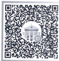
QR CODE กลุ่มอบรม สำนักงานศาลปกครองเพชบูรณ์