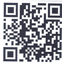
QR CODE กำหนดการ